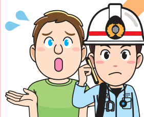
外国の方 救急隊員